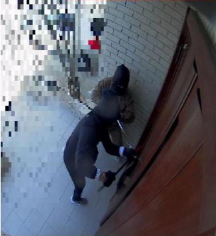
※別件事件の防犯カメラ映像

事例 本年5月のGW期間中、名東区内において白昼堂々、全身黒づくめの3人組がバールを所持し、被害者が留守中に家前の門扉を破壊する住居侵入未遂事件が発生しました。